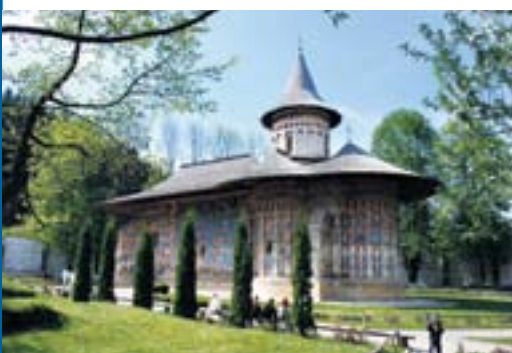
Une église décorée de peintures à l'extérieur.

Les monastères de Moldavie, Maramures, la Transylvanie, les églises peintes de la Bucovine, puis Bucarest